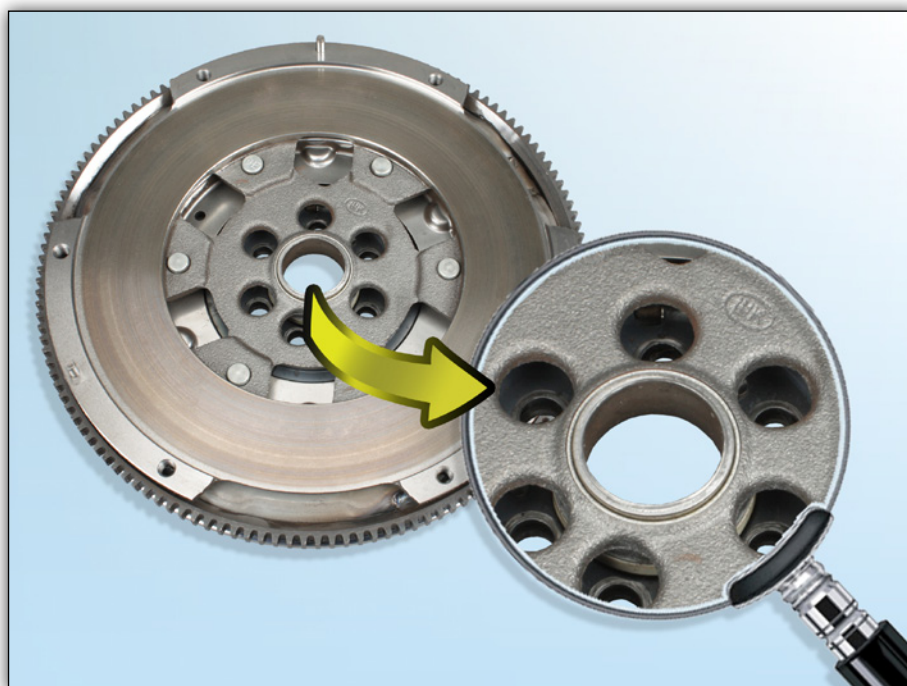
Image 1 : Volant bimasse LuK 415 0059 10 avec palier lisse

Les véhicules cités plus haut peuvent être équipés d'un volant bimasse LuK ou Sachs. Ces deux volants bimasse se distinguent l'un de l'autre par leur conception mais ils ne sont pas évidents à différencier.