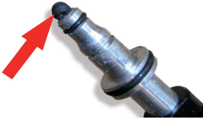
Image 4 : Si le joint d'étanchéité usagé n'a pas été retiré, il risque d'être poussé vers la butée et de boucher le flexible

Il est nécessaire de purger le système après remplacement de la butée hydraulique. La procédure de purge se fait en deux étapes. D'abord la purge de la commande d'embrayage ; ensuite et séparément, la purge de la butée hydraulique.