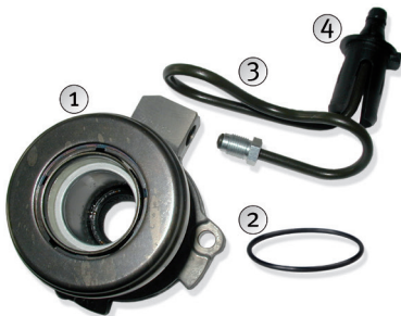
Image 1 : Ne pas réutiliser les éléments (ci-dessus) préalablement montés.

Image 1 : Retirer la butée hydraulique (1), le joint d'étanchéité de la bride du carter de boîte de vitesses (2), le flexible raccordé (3) ainsi que le manchon en plastique (4) destiné