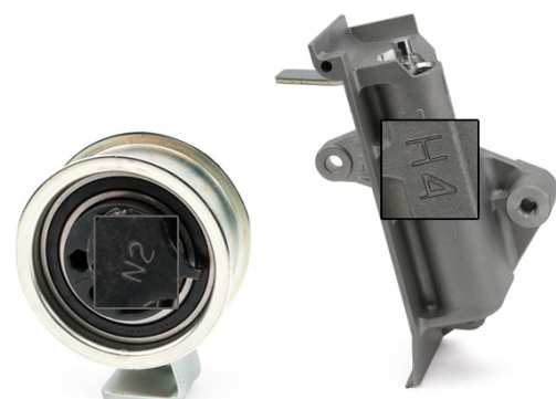
Photo 2: Galet tendeur réf. 531 0436 20 avec amortisseur de vibrations réf. 533 0035 10